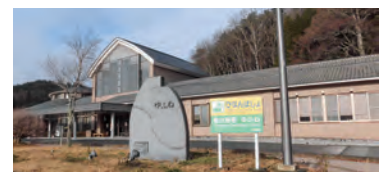
保健・福祉・医療複合施設ゆふね

昨年度発行された第1号に続き、さらに川内村社協の活動を知っていただくべく、今年度も広報誌を発行いたしました。今回は社協が主催するサロンの様子を中心に掲載いたしました。広報を通して、少しでも多くの方にサロン等の活動に参加していただければ幸いです。