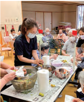
梅干しづくりに奮闘中です