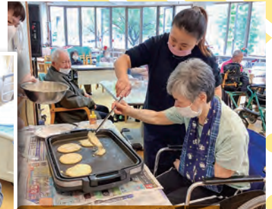
ホットケーキおいしく焼けました