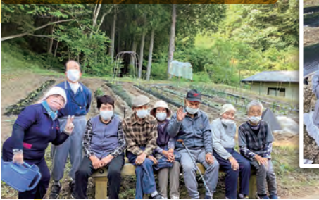
畑も作ってます。できた野菜はデイサービスの昼食に！

社協デイサービスでは、利用者の方々に心身ともに元気に過ごしていただく為、入浴、食事等支援の他、日々の生活に彩りを添えることができるような様々な活動を午後のレクリエーションの時間を通して提供しています。