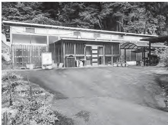
かわうちラボ空き家・空き地バンク登録物件