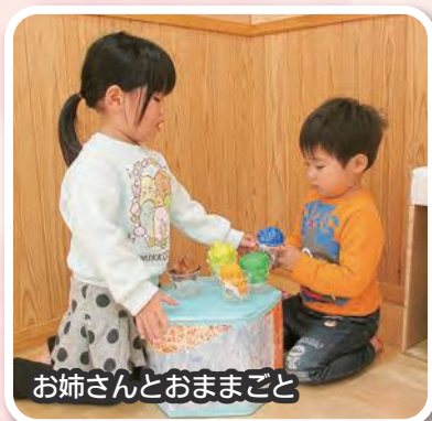
お姉さんとおままごと