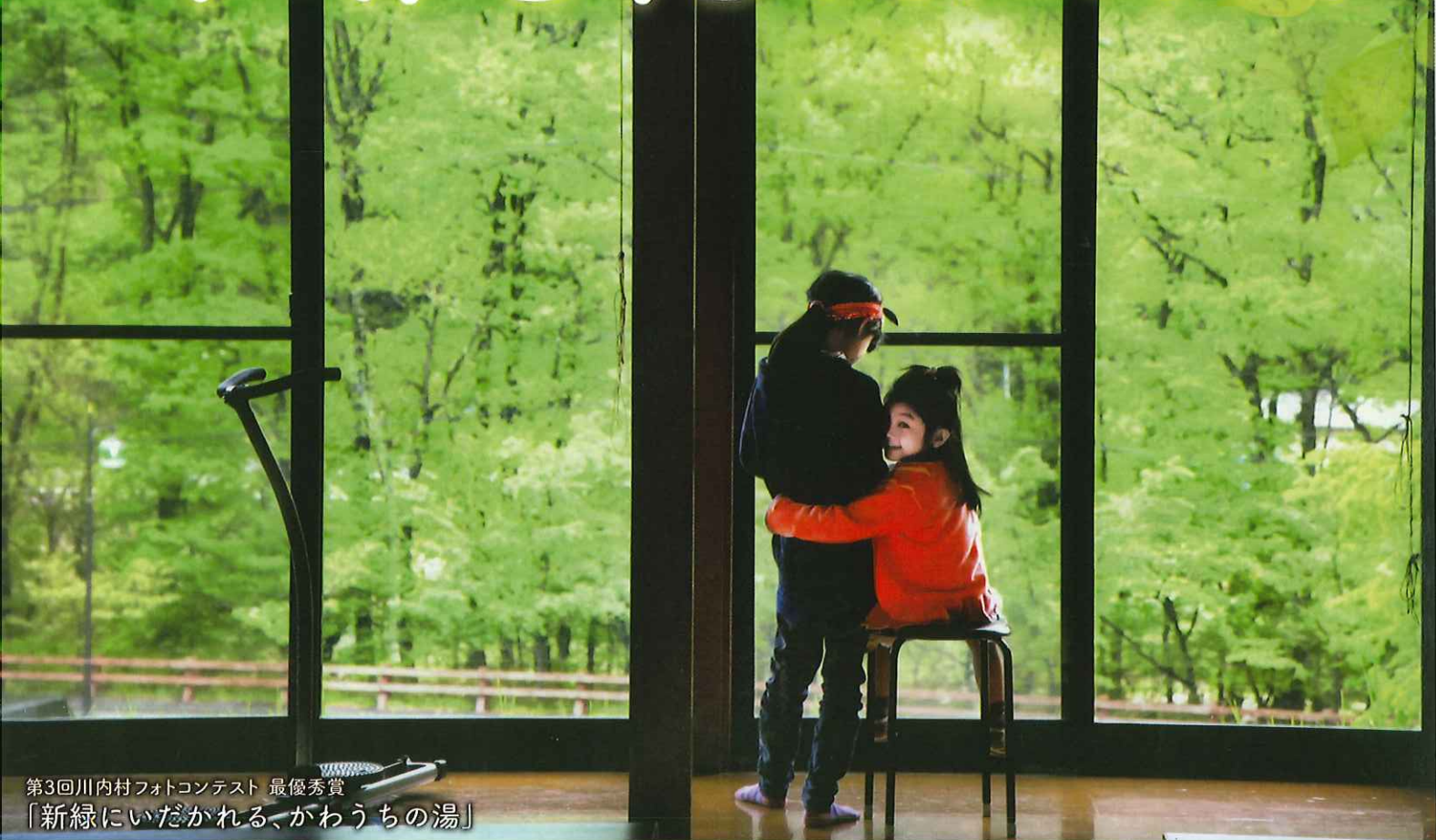
第3回川内村フォトコンテスト 最優秀賞 「新緑にいだかれる、がわうちの湯」