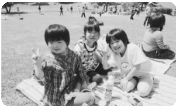
三崎公園でお弁当