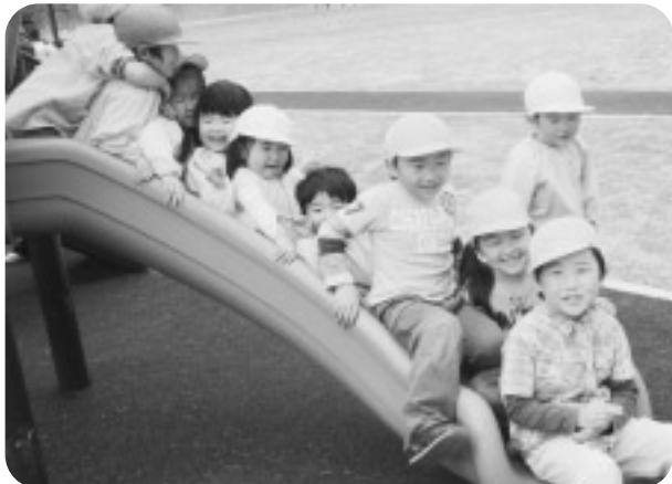
みんなで仲良くすべり台

5月7日（金）かわうち保育園の遠足を行いました。保育園からすわの杜公園まで、道端のタンポポや虫たちを観察しながら歩きました。