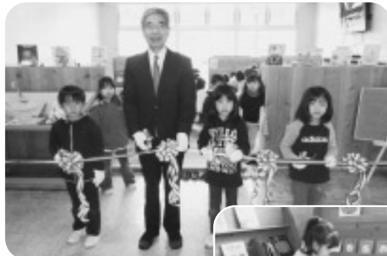
テープカットの様子