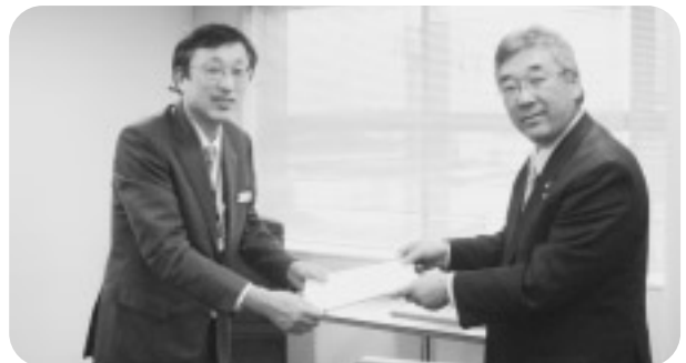
武田福島支店長に要望する村長

情報通信の発展に伴い、私たちの生活環境の利便性が向上し、そして携帯電話はいまやなくてはならない生活必需品となりました。本村の携帯電話通話地域は、全面積の8割地上で通話可能となっております。しかしながら第8区地域は不通話地域であることから、このたびNTTドコモ福島に対して早期の基地局建設の要望活動を行いました。この要望は平成18年7月に5か所を行いました。昨年度まで3か所構築され、残りの五枚沢、毛戸地域の新たな基地局建設と合わせて手古岡地域のエリア拡大を要望したものです。