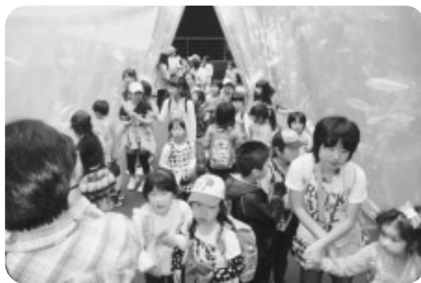
お魚いっぱい（アクアマリン）